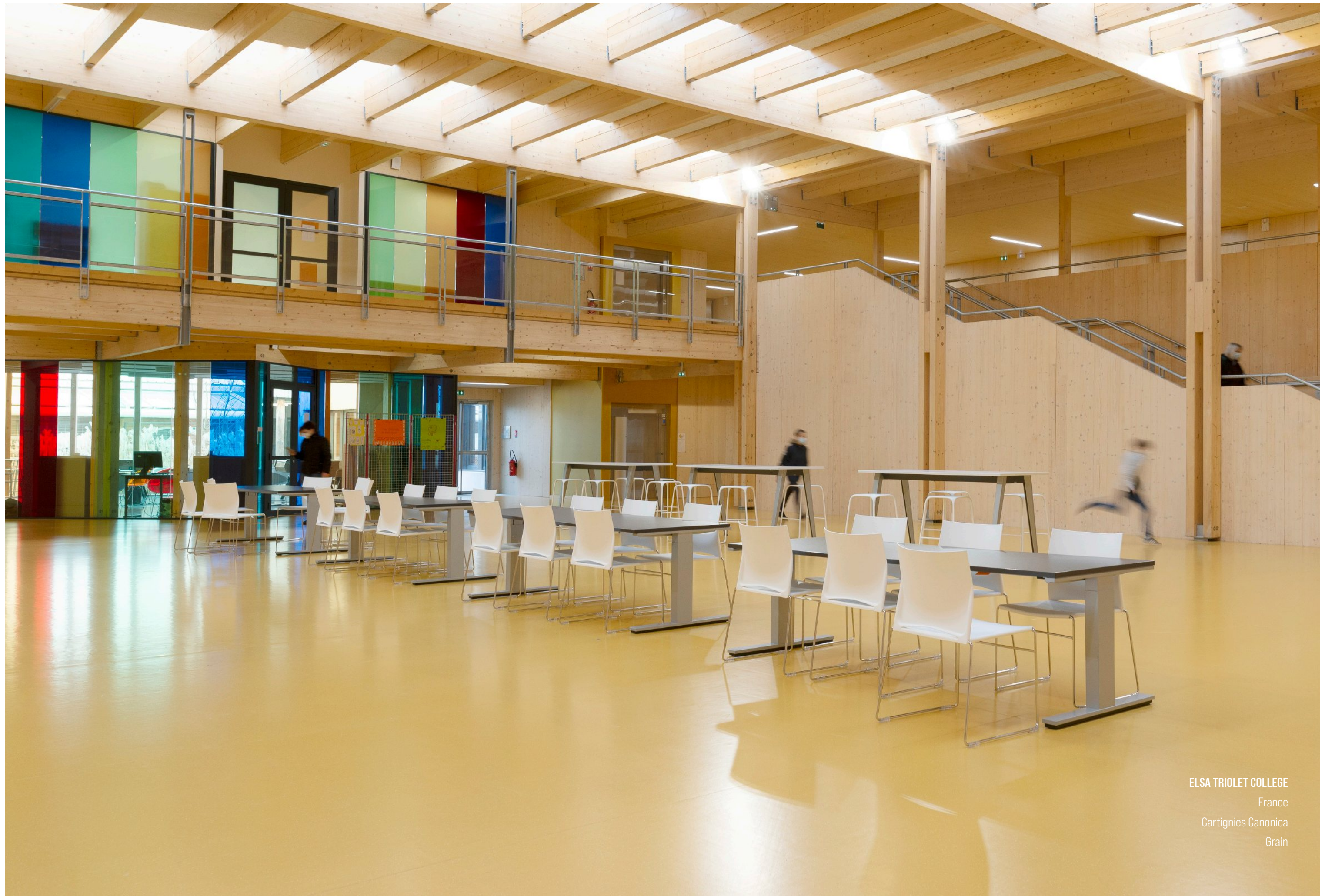
ELSA TRIOLET COLLEGE France Cartignies Canonica Grain