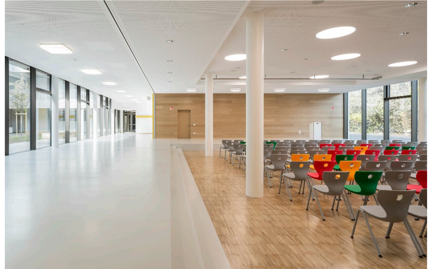
Architetti KUP - Kerschbaumer Pichler & Partner