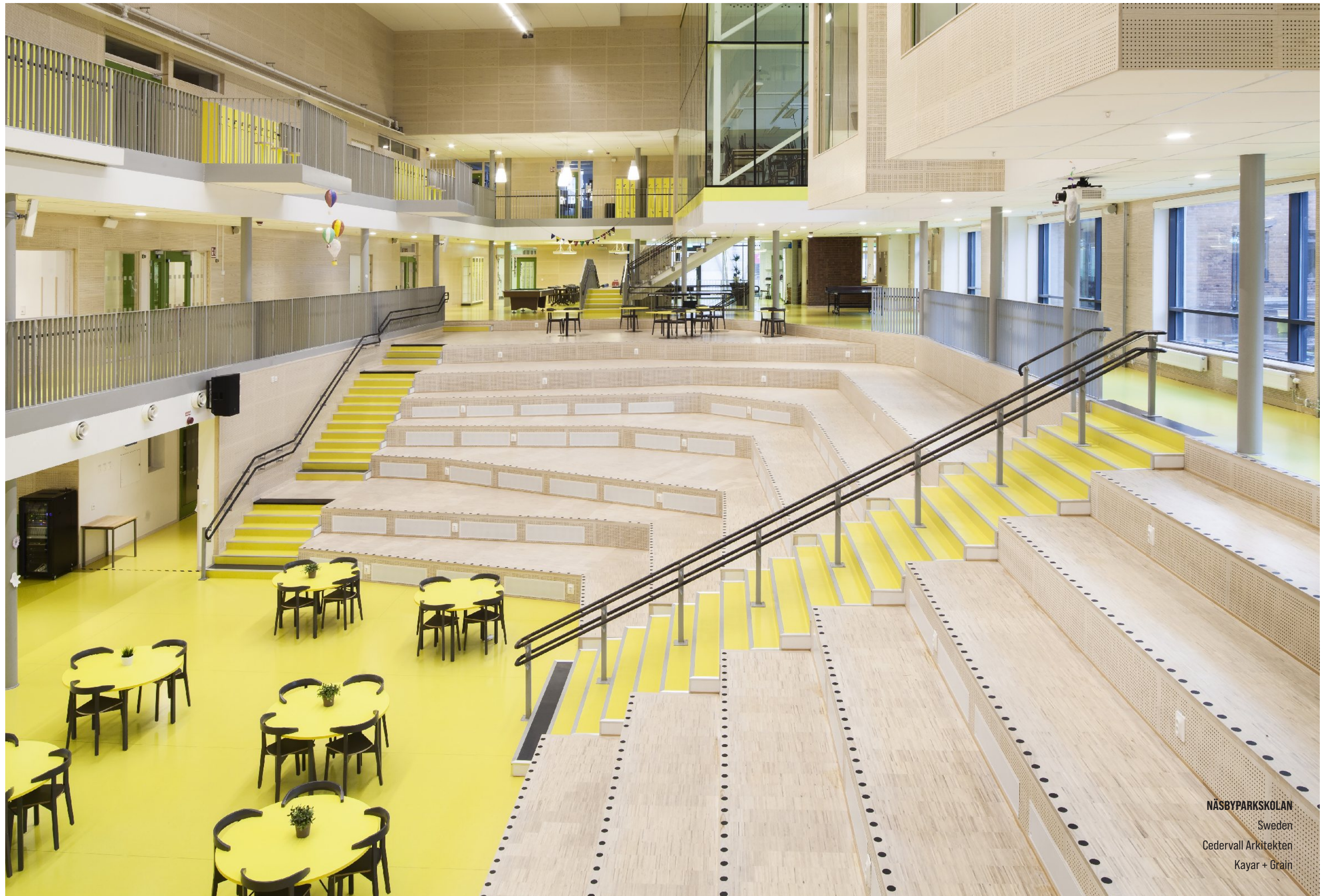
NÄSBYPARKSKOLAN Sweden Cedervall Arkitekten Kayar + Grain